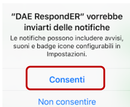
Figura 2 - Consenso notifiche

E' necessario fornire il consenso anche all'invio delle notifiche selezionando: Consenti